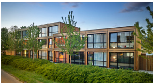
Finch Buildings

In relatie tot de verwachte beeldkwaliteit kunnen concepten geraadpleegd worden op www.conceptenboulevard.nl . Onderstaande voorbeelden bieden inzicht in de beeldkwaliteit van verschillende bestaande concepten in de markt.