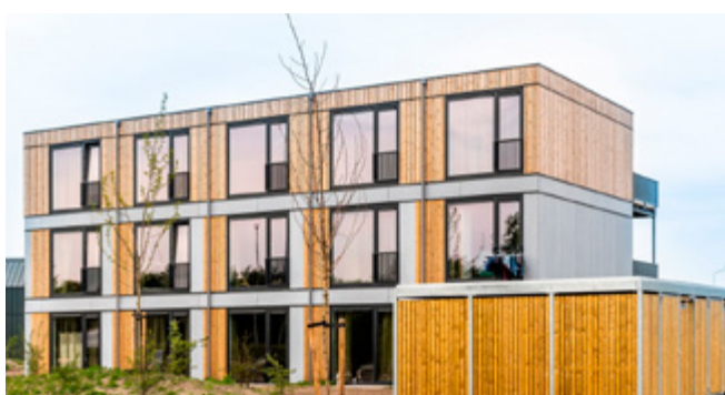
BarliBase Level