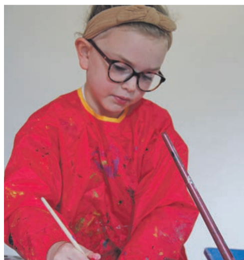
Wies beschildert een blaadje.