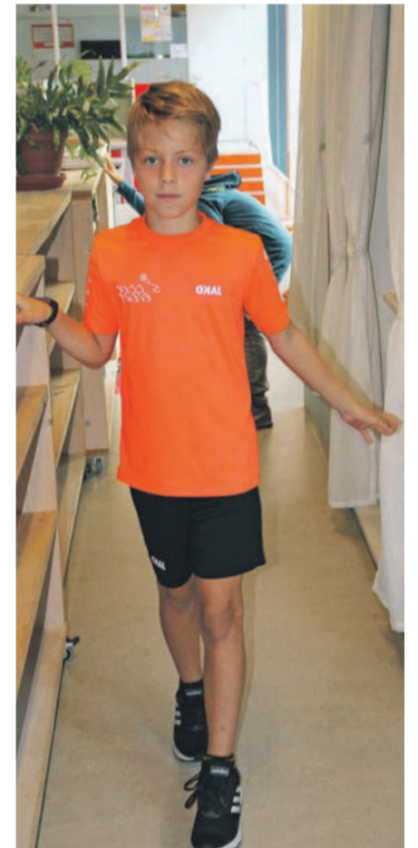
Looproutes in de school.

BERGEN – Alle scholen waren in maart en april gesloten. Alle leerlingen kregen online les. De scholen gingen in mei voor een deel open. Alex (12), Nilo (10), Zeeger (10) en Emma (8) van de Matthieu Wiegman school vertellen hoe de school en zij omgingen met de nieuwe regels. Zij vertellen ook hoe het nu is op school. Tekst en foto's: Miranda Loonstra