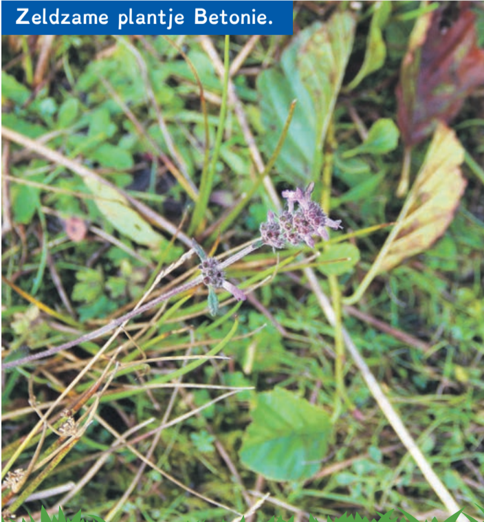
Zeldzame plantje Betonie.