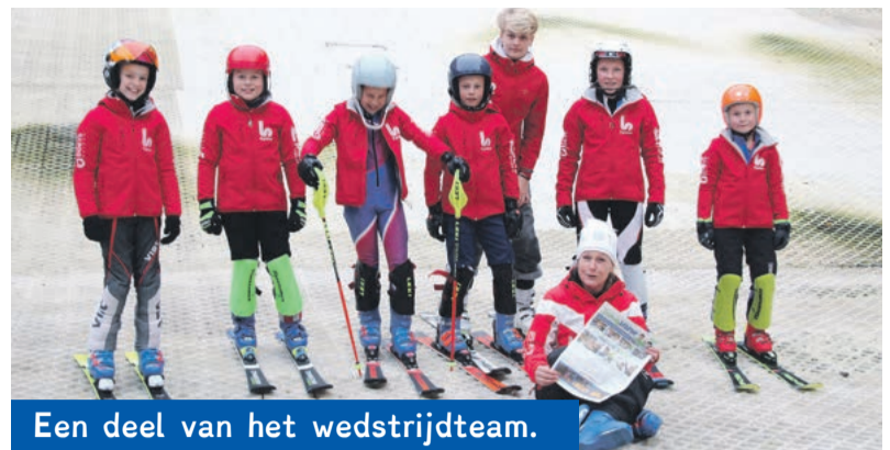
Een deel van het wedstrijdteam.