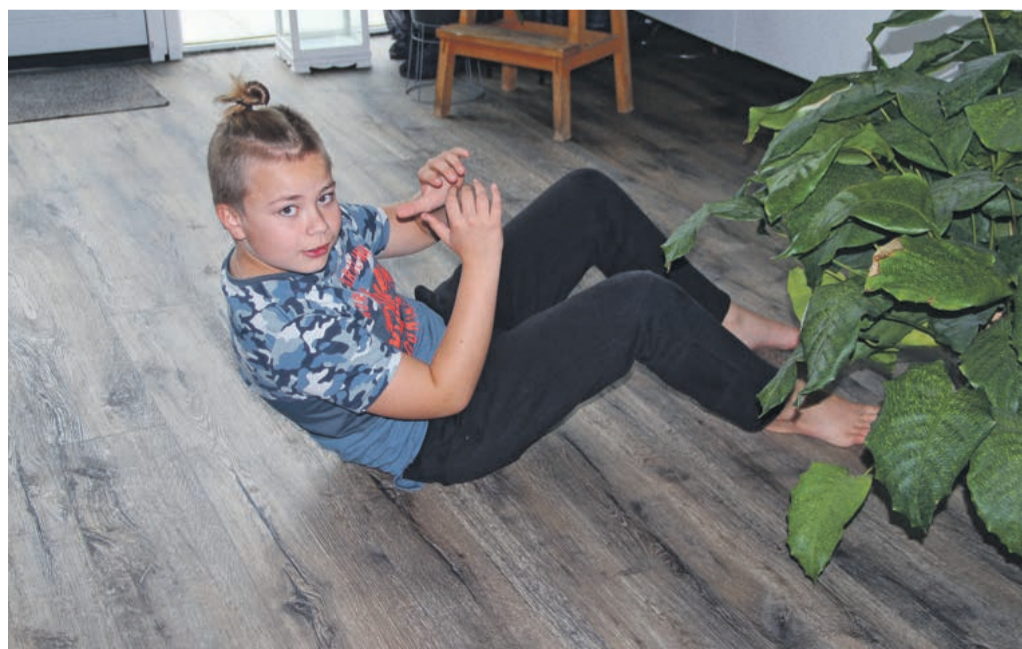
Fit blijven in coronatijd.