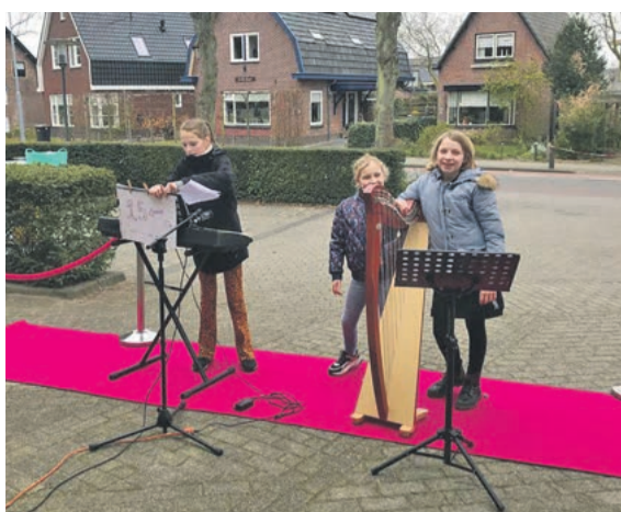
Optreden voor verzorgingshuis Hoog Duinen.