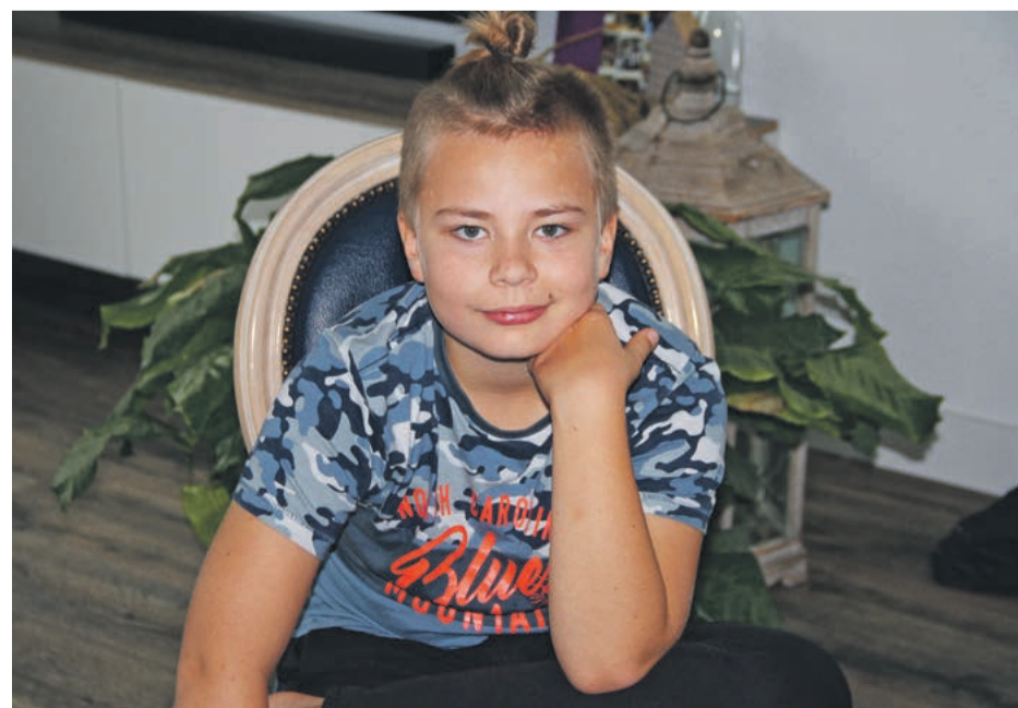
Thuisquarantaine duurde voor zijn gevoel lang.