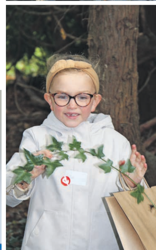
Wies verzamelt klimop.