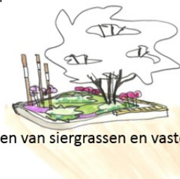
Toepassen van siergrassen en vaste planten