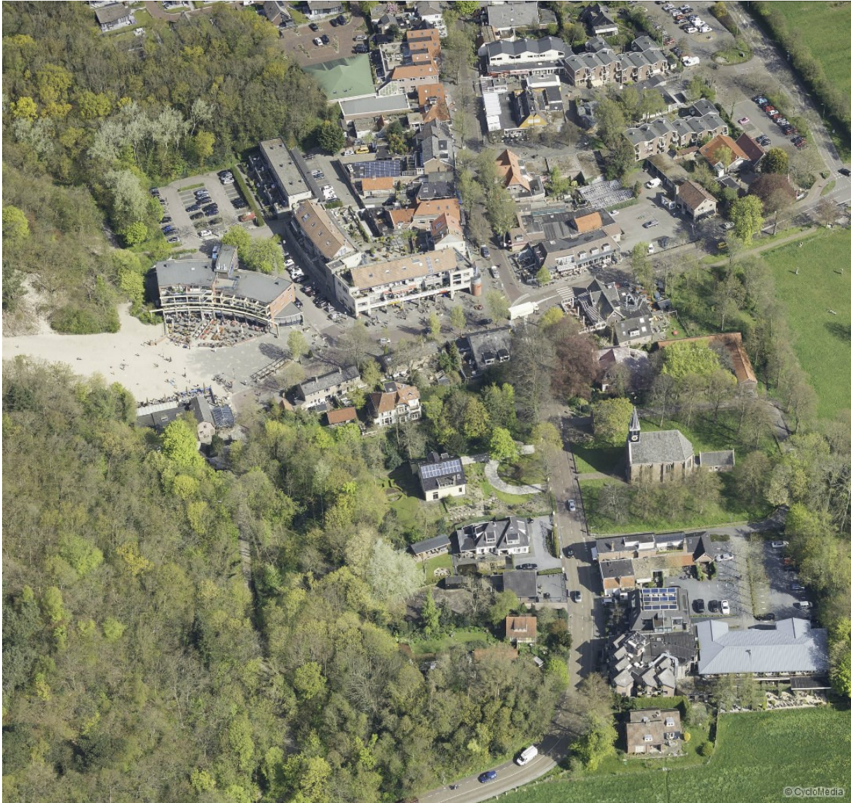
Afbeelding 2: gedeeltelijk overzicht project (luchtfoto in vogelvlucht, 2016)