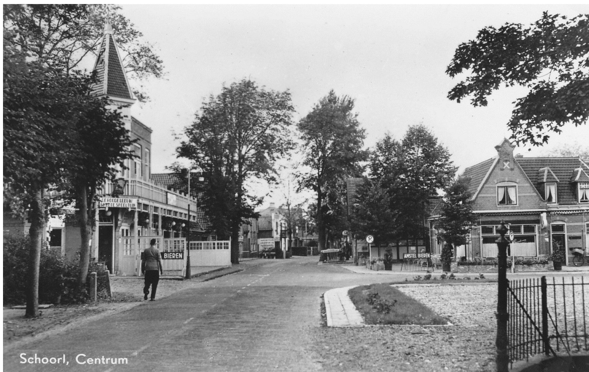
Afbeelding 1: Kruispunt Laanweg/Duinweg (rond 1950) gericht naar het noorden.

Tijdens de voorbereiding wordt gebruik gemaakt van de creativiteit van de belanghebbenden in het gebied. Hierbij wordt ook de inbreng die in het verleden is gegeven en beschreven staat in de "Visie Dorpshart Schoorl" betrokken. Belangrijk is dat er overeenstemming is tussen alle partijen. Een ingenieursbureau krijgt de opdracht om op basis van de randvoorwaarden en de gezamenlijke bepaalde ambitie een schetsontwerp te maken. Van het schetsontwerp wordt na de informatieavond een voorlopig ontwerp (v.o.) gemaakt, die inclusief financiële paragraaf wordt voorgelegd aan de raad.